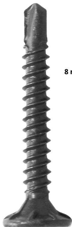
8 mm x 1 1/4" PULG